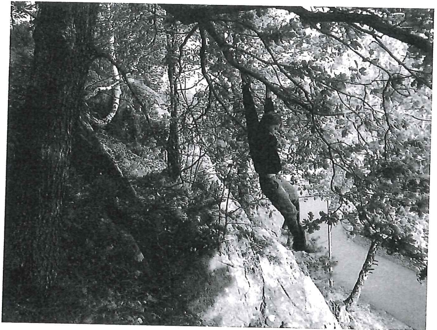
Birk går armgang i tre.

deres selvframstilling være rolig og behersket, mens dersom det nærmer seg en konkurrent, blir de preget av dette og klatrer hurtigere. Men uansett om jentene klatrer raskt av sted i veggene, utstråler Siv og Maia en trygghet når de er i denne klatrevæggen. Siv og Maia sin klatring i klatrevæggen på fritida har karakter av kroppslig beruselse. Dette skjer blant annet ved at jentene setter deres likevektsans på prøve. I klatringer eksperimenterer barna med kroppens grenser og muligheter, og gjennom denne eksperimenteringen utvikler de kroppsbeherskelse og stedsforståelse. Relasjonen mellom barna og deres steder utvikler seg gjennom erfaring og utprøving.